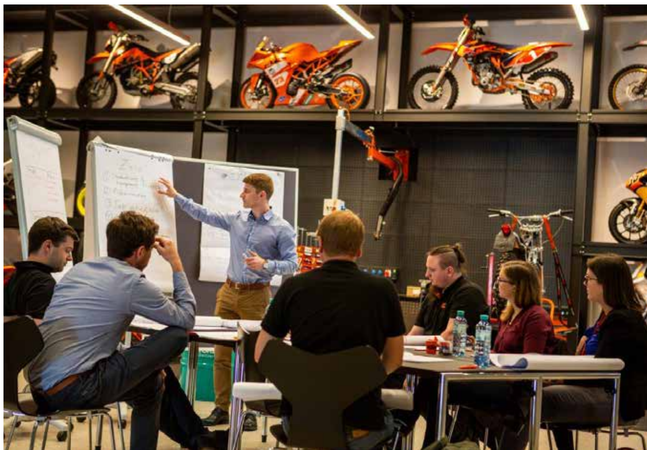
KTM buchte den Lehrgang „Digital Transfer Manager“ bereits mehrmals als Inhouse Training.

Das Qualifizierungsprogramm 2020/21 des AC dient als Basisangebot. Darüber hinaus finden auch Inhouse-Schulungen sowie individuelle und maßgeschneiderte Kurse, Seminare und Lehrgänge statt. Der Lehrgang „Digital Transfer Manager“, der von vielen Unternehmen mehrfach als Inhouse Training gebucht wurde, trägt zur Generierung neuer, innovativer digitaler Lösungen bei.